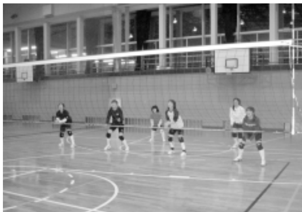
学校開放事業でのバレーボール練習 (明治中学校体育館)