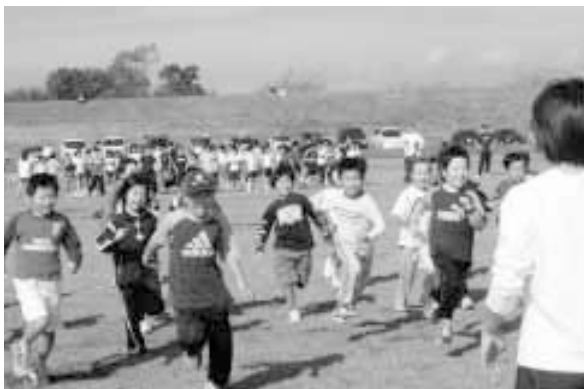
元気よく走る参加者たち