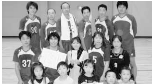
優勝したゆうきが丘