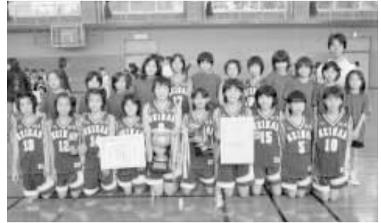
優勝した明治ミニバスケットボール