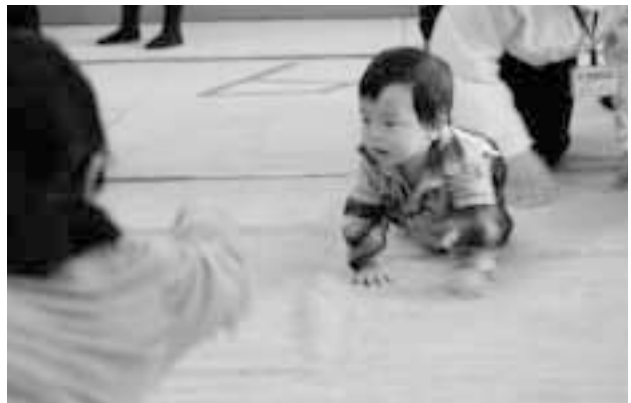
ママのかけ声に合わせて進む赤ちゃん（健康福祉祭り）