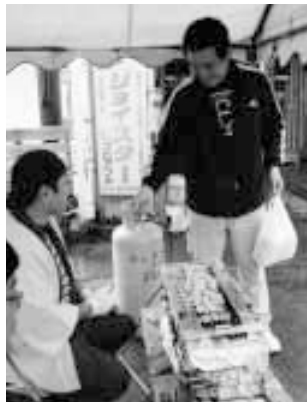
串焼きをお土産に （農業祭）