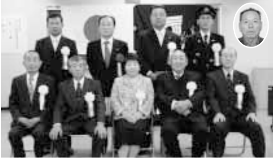
表彰された皆さん