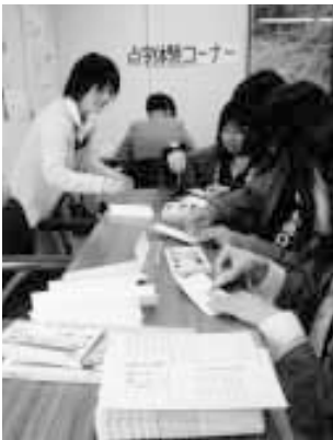
点字コーナーでのぬり絵 （健康福祉祭り）