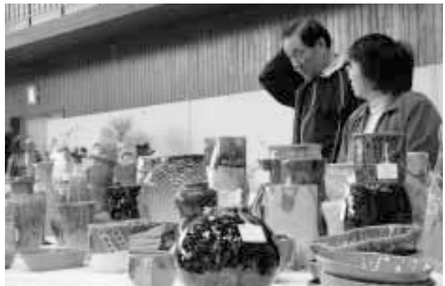
楽しみながら陶芸に見いる人たち（文化祭）