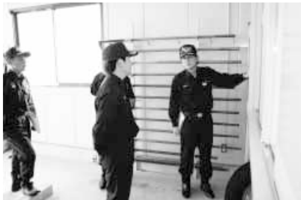
消防機械器具置場で指導をうける消防団員