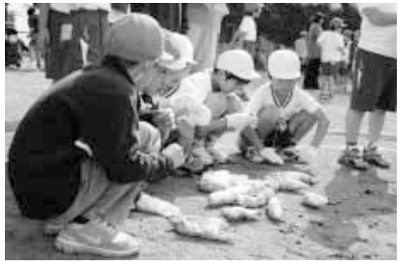
収穫した焼きたてのサツマイモ…おいしいかな!?

P T Aや生徒、そして生徒たちの祖父母約930名が参加。「はないちもんめ」や「あやとり」などの昔ながらの遊びで交流を深めた後、児童が収穫したサツマイモと上三川地区社協が用意したサンマを炭火で焼き、おじいちゃんおばあちゃんと一緒に、旬の味覚を味わいました。