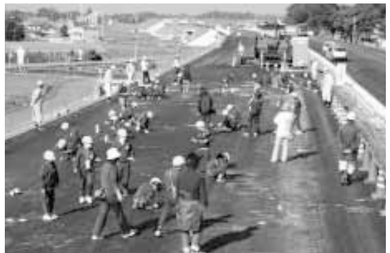
様々な思いを描く本郷小学校の生徒たち

NEXCO東日本による、地域に対しての還元プログラムとして、本郷小学校の生徒を対象に実施。関係者からは、「この子たちも大きくなれば、自動車に乗るでしょう。そのときに『この場所に絵を描いたなあ。』と思って運転してもらえれば、うれしいですね。」と話していました。