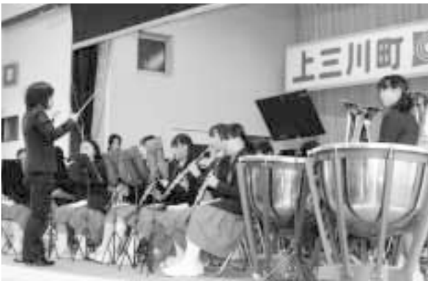
練習の成果を発表する明中生（オープニング）

最終日には、JAうつのみや上三川営農経済センターでの農業祭。また、上三川通りでは稚児行列が行われ、きらびやかな装束に身を包んだ稚児たちが山車を先導し、華やかな雰囲気を演出していました。