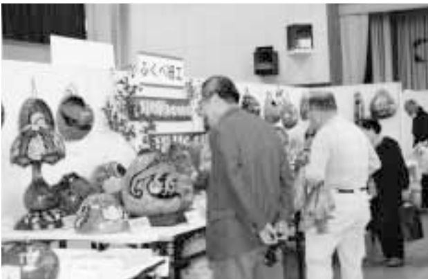
ふくべ細工の良さを味わう人たち（文化祭）