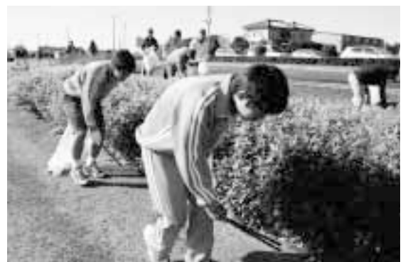
国道4号線沿いを清掃する中学生と栃木工場の社員たち

参加した社員の人たちは、「みんなできれいで輝く町に、できれば非常にいいですね。」と話していました。