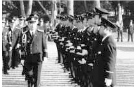
整列し服装点検を受ける消防団員

18日(日)には、富士山公園で通常点検が行われました。日頃の消防団活動や訓練成果を披露。長年活動に従事された団員には、栃木県消防協会長等から表彰状が手渡されました。(各受賞者は下記のとおり)点検終了後は、上三川通りで分列行進を行い、消防団の士気の高さを披露しました。