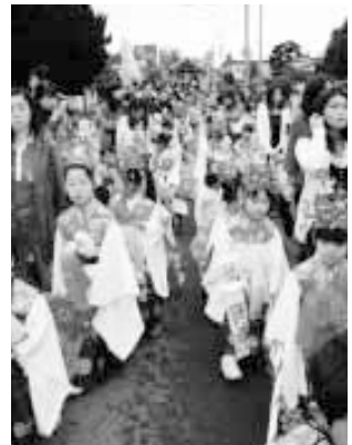
華やかな稚児たち （稚児行列）