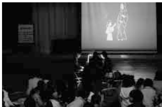
影絵を実演する読み聞かせボランティア