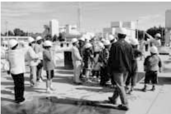
下水道の仕組みについて説明を受ける参加者