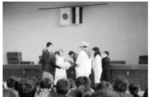
エイズキルトを手渡す明治中学校生徒

歓迎セレモニーでは、明治中学校剣道部による模範試合や合唱部による合唱を披露。明治中学校の生徒たちが制作した「エイズキルト」を贈呈すると、保健省の事務局長さんは、「エイズキルトを国のエイズ予防のために大切に使っていきます。」と感謝の言葉を述べていました。