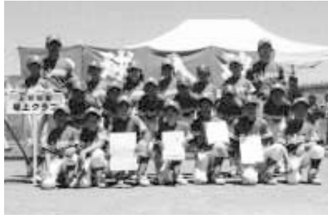
学童野球で優勝した坂上クラブ

6月3日(日)・10日(日)・17日(日)・23日(土) 蓼沼緑地公園 優勝 勝 坂上クラブ 準優勝 上三川クラブ 第3位 明治クラブ