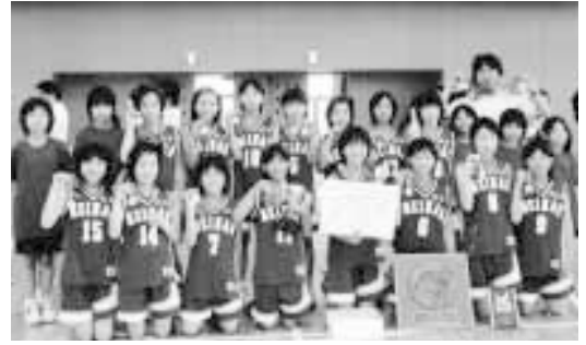
優勝した明南ミニバスケットボール

6月10日(日)～17日(日) 女子の部 優勝 明南ミニバスケットボール 男子の部 第三位 明治MB