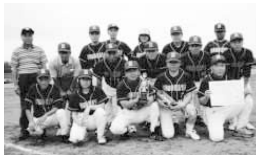
ソフトボールで優勝した桃畑

7月1日(日)・8日(日) 桃畑緑地公園 優勝 桃畑 準優勝 ゆうきが丘 第三位 美里 西汗下