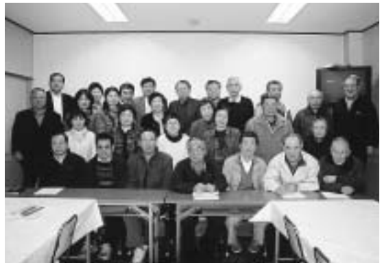
さわやか会の役員のみなさん

「健やかで、美しく、豊かな上三川のために…」をモットーに、様々な環境保全活動を実施していきます。