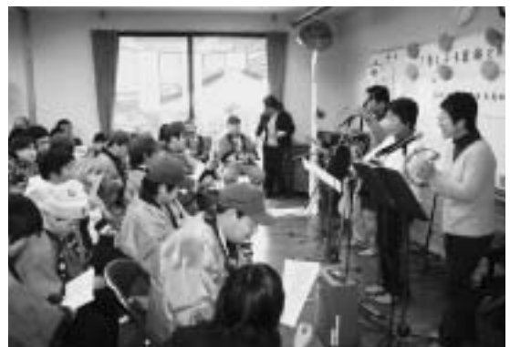
「こんぺいとう」と一緒に楽しく歌いました

開所以来お世話をしてくださった人たちなどの来場者と通所者が、交流を深めました。上三川地区社協による、わた飴やカレーライスなどの配布や、個人作品展示、作業体験コーナーなどが設けられ、来場者は、福祉作業所の理解を一層深めていました。