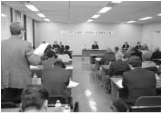
意見交換を行う参加者