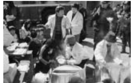
婦人防火クラブによる炊き出し