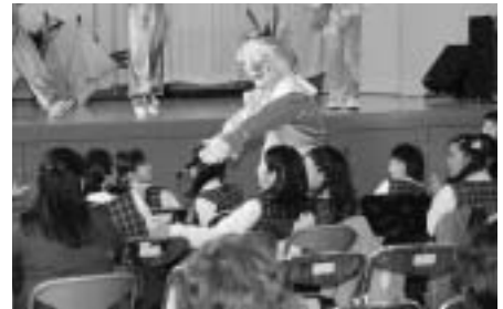
親子で楽しめたパントマイムショー