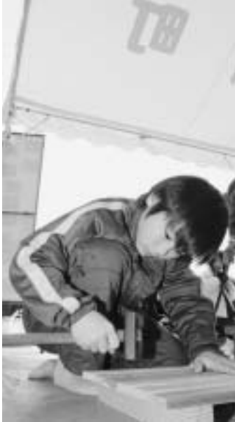
すのこ作りに挑戦