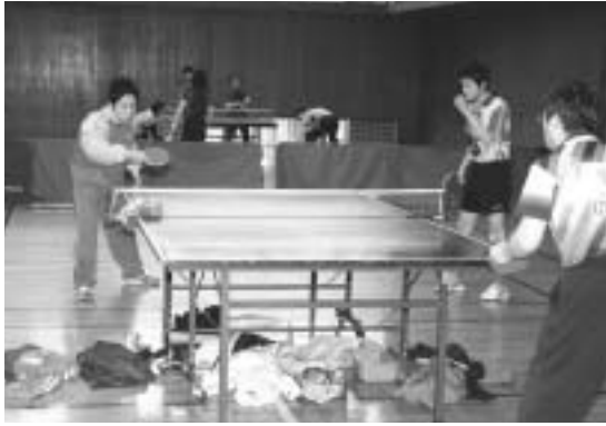
三原選手から指導を受けました