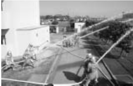
消防団・上三川分署による一斉放水

会場では、本番と同じように、消防団員や上三川分署員による消火訓練や、避難訓練が行われ、参加者は防災について再確認をしました。