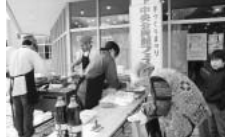
おいしかった青年団の焼きそば