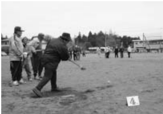
グランドゴルフを楽しむ参加者たち