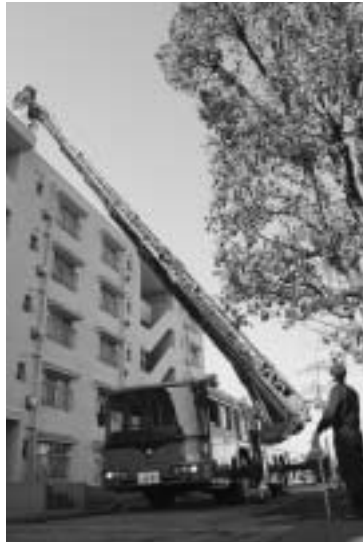
はしご車による救助訓練