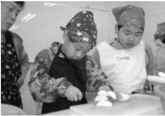
真剣な表情で料理をする子どもたち