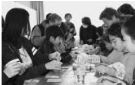
七宝焼きできるかな!?