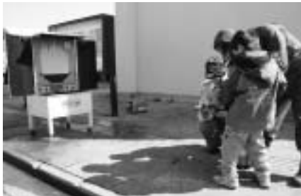
消火器でうまく火を消せるかな!?