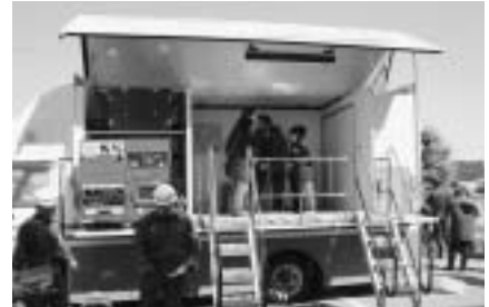
起震車による震度体験