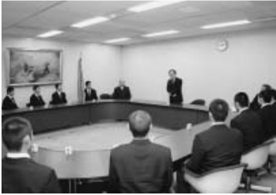
町長から激励を受ける出場選手たち