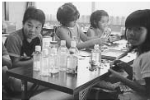
ペットボトルフラワー作り (夢沼児童館)