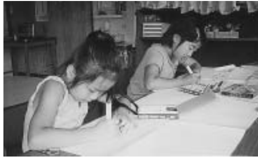
オリジナルキーホルダー作り（願成寺児童館）