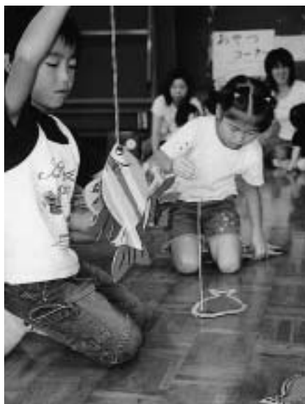
おもしろゲーム大会（夢沼児童館）