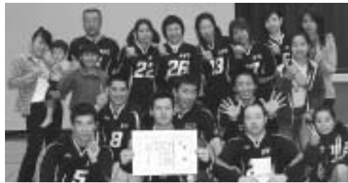
一般バレーボール大会で優勝したHVC

11月6日(日) 日産自動車体育館 優 勝 〓 HVC 準優勝 〓 ゆうきが丘 第3位 〓 並木 願成寺