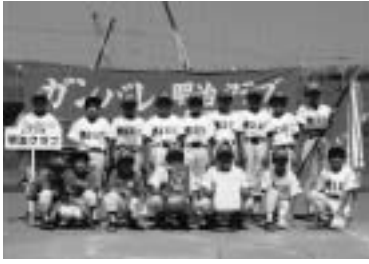
学童野球で軟式野球大会