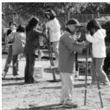
昔からの伝統の遊び「竹馬」 うまく乗れるかな