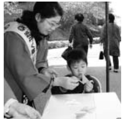
折り紙で動く折り鶴作り