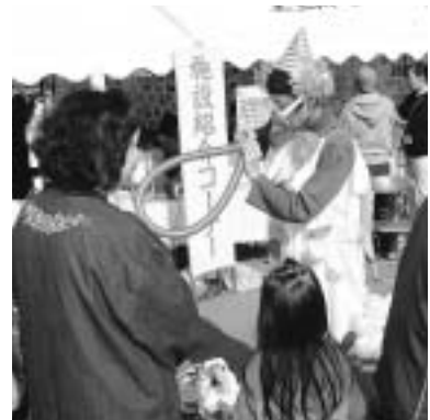
風船で大道芸を披露