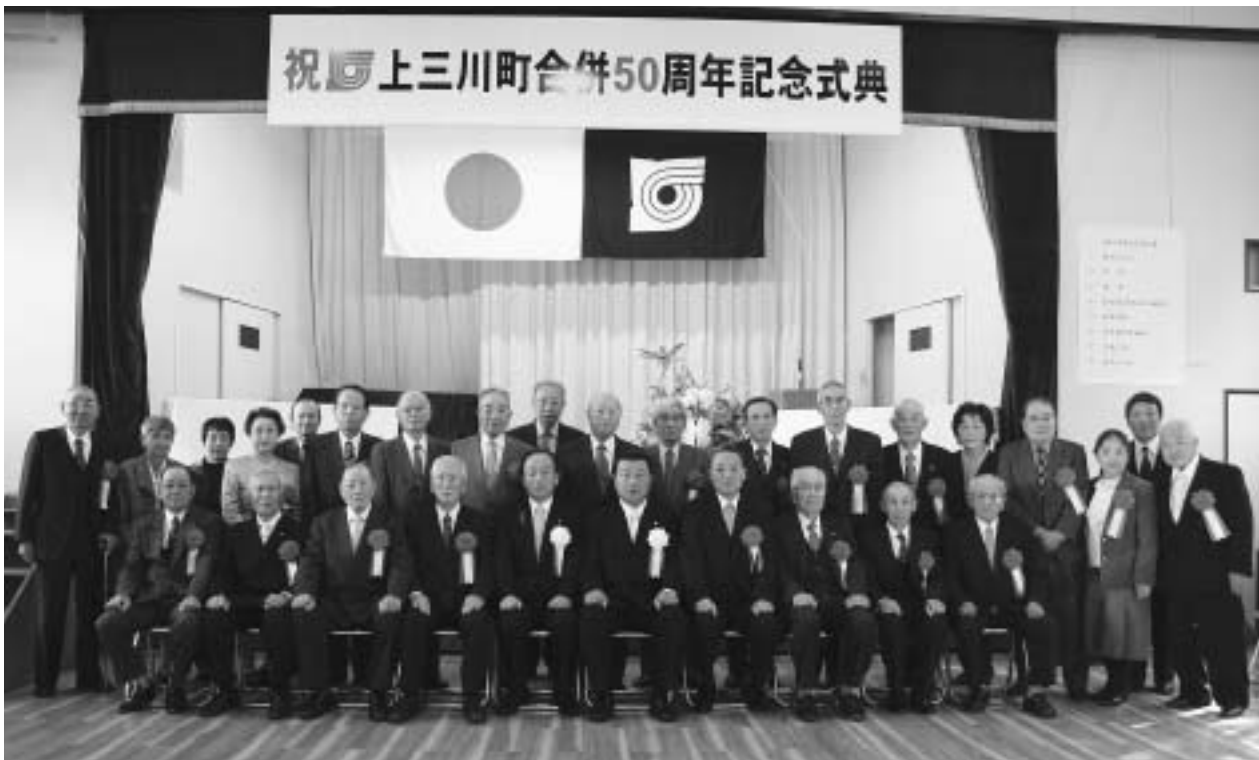
感謝状贈呈者（当日出席者）