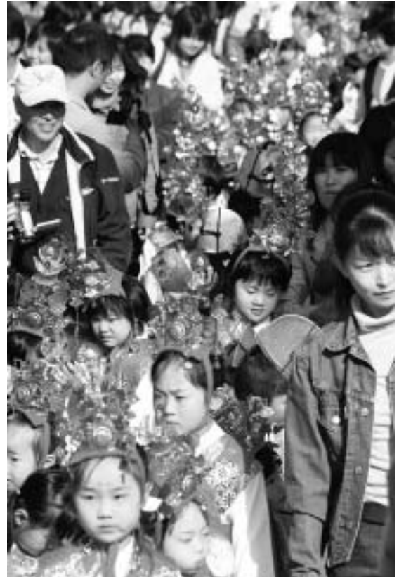
みんなキレイに可愛らしく稚児行列