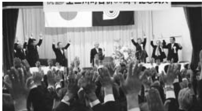
合併50周年を祝しての万歳三唱