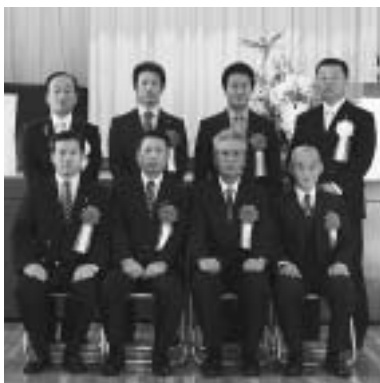
自治功労表彰受賞者(当日出席者)