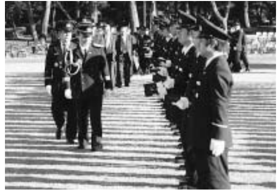
服装点検を受ける消防団員

空気が乾燥しているこの季節、火の元に気を付けて消防団のお世話にならないようにしましょう。