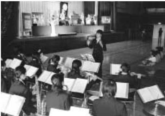
人形劇の音色を奏でる明治中の生徒たち