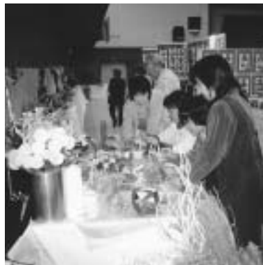
フラワーアレンジメントは いかがですか？