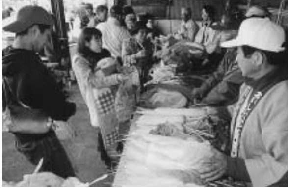
農業祭での無償配布には多くの人が集まりました