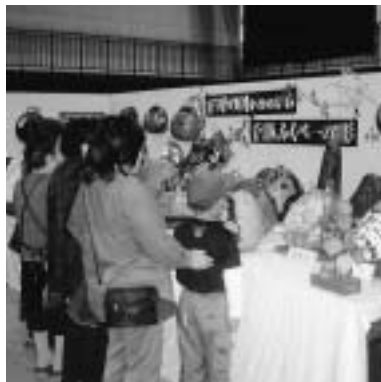
名人たちのふくべ細工