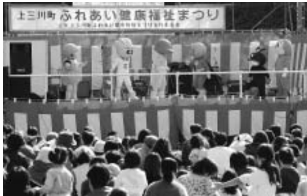
子どもたちに人気のアンパンマンショー

健康福祉祭りでは、「赤ちゃんハイハイ大会」が開催され、かわいい赤ちゃんの姿に、会場は和やかな雰囲気と、笑い声に包まれました。