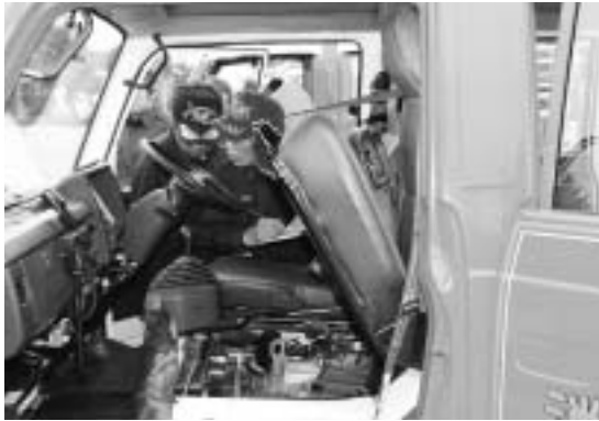
車両が整備されているか確認する消防団幹部

管理が良好な分団（第3分団第3部・第1分団第1部・第2分団第4部）は、通常点検時に管理調査優秀部として表彰されました。