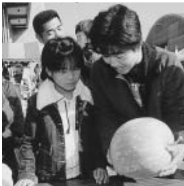
カボチャの重さは何キロかな？