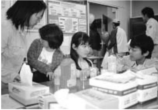
ろ過の仕組みについて説明を受ける親子