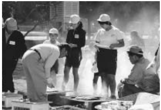
「早く焼けないかなあ〜」

P T Aや児童の祖父母が参加し、みんなで「たるまんがころんだ」などで遊んだ後、児童が収穫したサツマイモと地区社協が用意したサンマを炭火で焼き、おじいちゃん、おばあちゃんと一緒に笑顔で食べていました。1,000匹用意されたさんまは、焼き上がるとたちまち無くなり、子どもたちは「とても美味しかったです。」と旬の食べ物を味わいました。