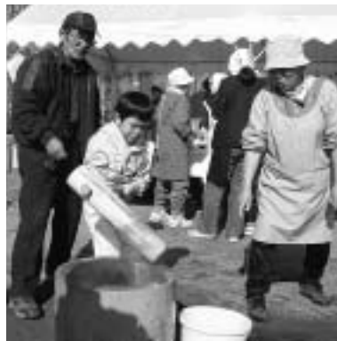
餅をペタンペタンうまくつけるかな？