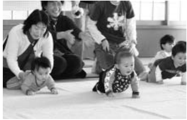
健康福祉まつりの一番人気赤ちゃんハイハイレース