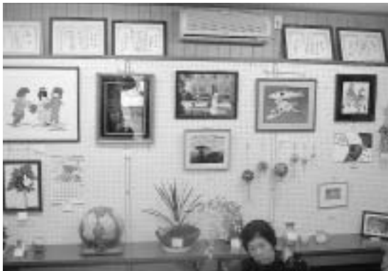
美里会員たちのすばらしい作品