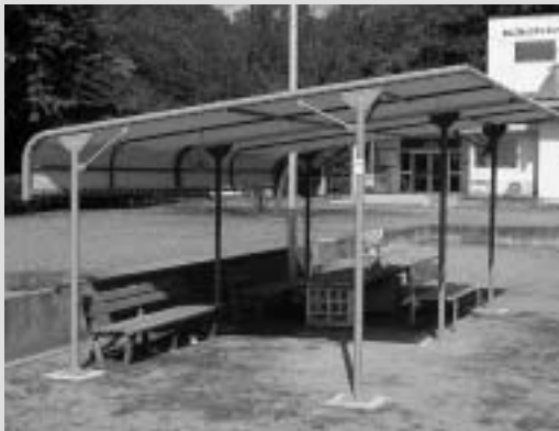
坂上コミュニティセンターのテント休憩所

町内の各コミュニティ推進協議会では、コミュニティ祭り、各種教室などのコミュニティ活動の推進に活用しています。