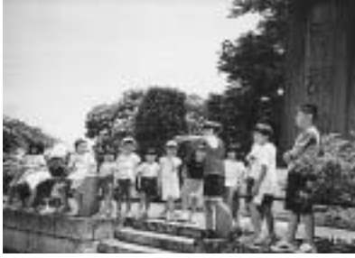
紙ヒコーキどこまで飛んだかな

「夏休み手づくり教室」 ○ロケットゼミ・かぶと虫カー ▼とき＝8月5日(金) 午前10時～正午 ▼用意＝500mlの牛乳パック2本(きれいに洗ってき てください)、おこふき ▼材料費＝無料 ▼対象＝小学生 ▼申込み＝先着20名で締め 切り。電話でもOK ※8月5日は作った作品で、 みんなで遊びましょう。