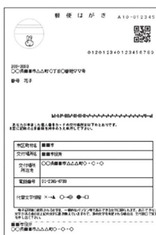
交付通知書(はがき)

※申請していただいた方で、マイナンバーカードが不要になった方は、交付申請取消出書の提出が必要となります。