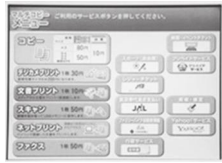
【マルチコピー機画面】

午前6時30分～午後11時 ※毎年12月29日～翌年1月3日、及びサバメントナンス等の保守点検時を除く