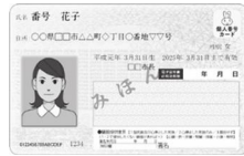
【マイナンバーカード】